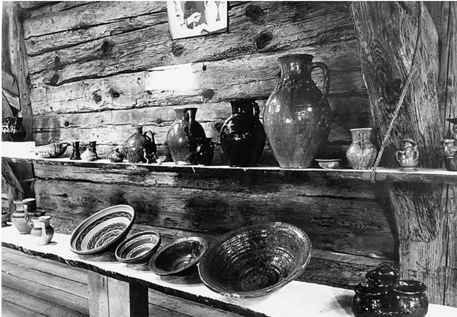
1. Wystawa czasowa pn. „Ceramika ludowa”, 1978 r.

Pierwszymi zrealizowanymi w historii skansenu wystawami były: wystawa pt. „Sztuka ludowa na Opolszczyźnie” oraz wystawa fotograficzna pt. „Piękno ludowej architektury” – obie udostępniono zwiedzającym w 1970 r. Od początku istnienia placówki zrealizowano ponad 200 wystaw czasowych 6 . Niektóre z nich w ostatnich latach uzyskały nagrody i wyróżnienia w ogólnopolskim konkursie „Wydarzenie Muzealne Roku – Sybilla” organizowanym przez