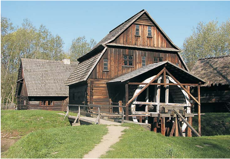
6. Zagroda młyńska z młynem wodnym z Siołkowic Starych (fot. E. Wijas-Grocholska)

nym kołem. Kompozycję zagrody uzupełnia niewielki ogródek usytuowany wzdłuż chałupy.