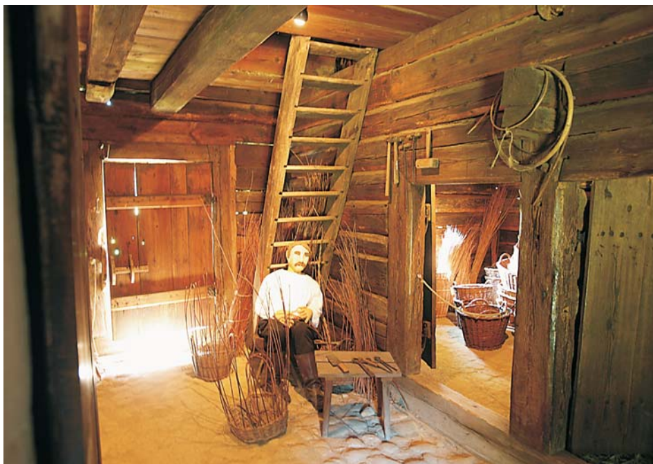
9. „Wyplatanie koszy” – chałupa z Budkovic, 1812 r.

drażu, tkaninę owiniętą wokół wałka magła. Taka prezentacja jest próbą stworzenia pewnej relacji, jaka powinna się nawiązać między dzisiejszym obserwatorem a dawnym wydarzeniem, faktem lub rzeczą 53 . W podobnej formie projektowane są też ekspozycje prezentujące niektóre zwyczaje i obrzędy doroczne. Przedstawienie ich w statycznej formie – bez ruchu i zmienności towarzyszących uroczystościom – z oczywistych powodów stanowi ogromny problem. Prezentacja ogranicza się zatem do jednego, materialnego aspektu ceremonii