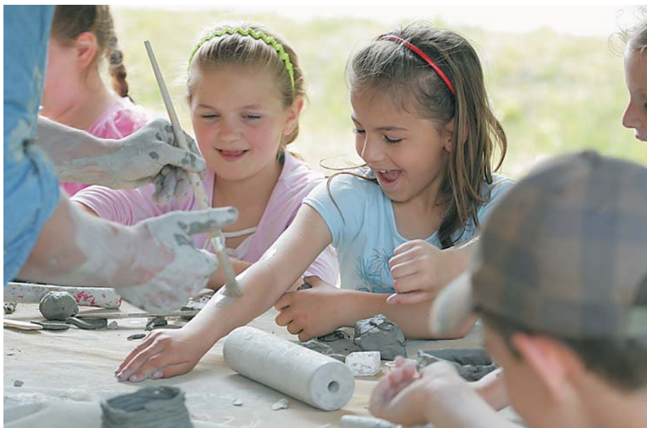
12. Najmłodzi w trakcie cieszących się dużą popularnością zajęć warsztatowych, 2009 r.

i gawędziarze – członkowie Opolskiego Stowarzyszenia Twórców Ludowych, a także wykwalifikowani rzemieślnicy, jednak większość tych zajęć prowadzi pracownicy działów merytorycznych Muzeum.