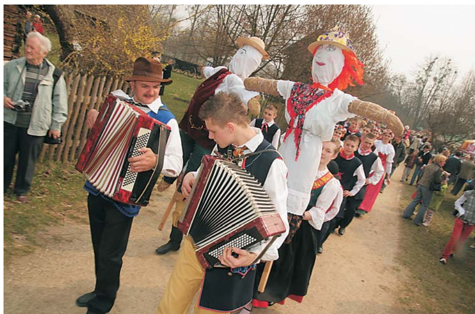
5. Prezentacja obrzędu topienia marzanny podczas „Jarmarku Wielkanocnego”, 2009 r.