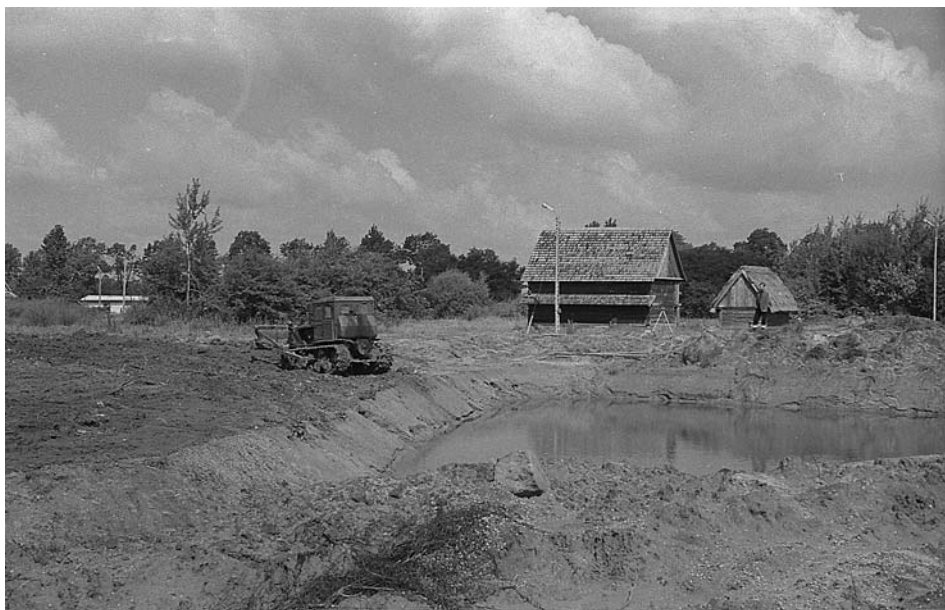
1. Roboty ziemne przy wykonywaniu cieków wodnych

wszystkim „gromadzenie, konserwacja, naukowe opracowanie i udostępnianie zabytków kultury ludowej Śląska Opolskiego, ze szczególnym uwzględnieniem budownictwa ludowego” 2 .