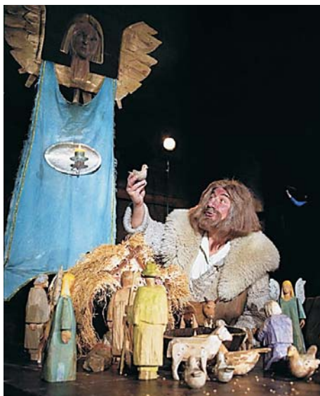
13. Spektakl Opolskiego Teatru Lalki i Aktora pt. „Pastorałki”, 2006 r.