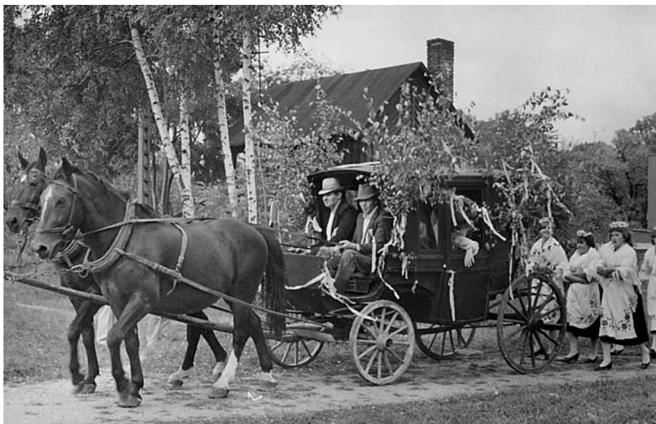
3. Impreza folklorystyczna pn. „Żniwniok opolski”, 1985 r.

klorystycznych, które ze względu na prezentowany repertuar i poziom występów, nie wychodziły ze swą działalnością poza własne środowisko 7 .