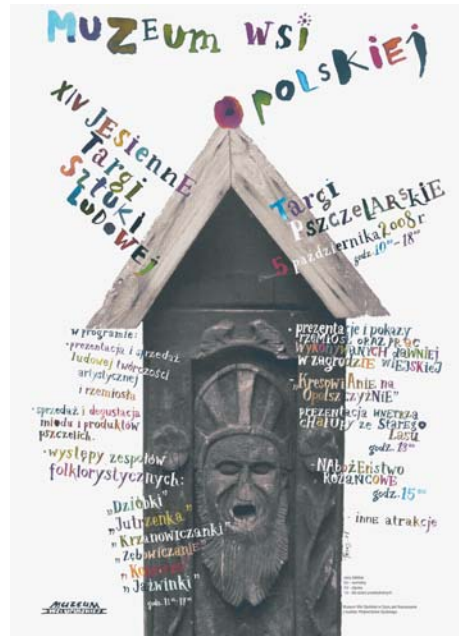
6. Plakat reklamujący „Jesienne Targi Sztuki Ludowej” 2008 r. (projekt B. Trzosa)

Od 2005 r. w okresie wakacyjnym na terenie Muzeum odbywa się „Festiwal Folklorystyczny”. Pierwsza impreza z tej serii nosiła nazwę „Festiwal Folklorystyczny. Góry Opawskie – Jeseniki” i była zorganizowana we współpracy z Miejscowym Kołem Polskiego Związku Kulturalno-Oświatowego w Republice Czeskiej z Jabłonkowa. Dzięki środkom uzyskanym z Europejskiego Funduszu Rozwoju Regionalnego (ERDF) finansującego Inicjatywę Wspólnotowe INTERREG przez trzy dni odbywał się on kolejno: na terenie hipodromu w Stadninie Koni w Chocimiu koło Prudnika, w Parku Zdrojowym w Głuchołazach i na koniec – w Muzeum Wsi Opolskiej w Opolu-Bierkowicach. W 2007 r. koszty organizacji festiwalu zostały pokryte ze środków własnych, natomiast rok później – imprezę sfinansowano w ramach Programu operacyjne-