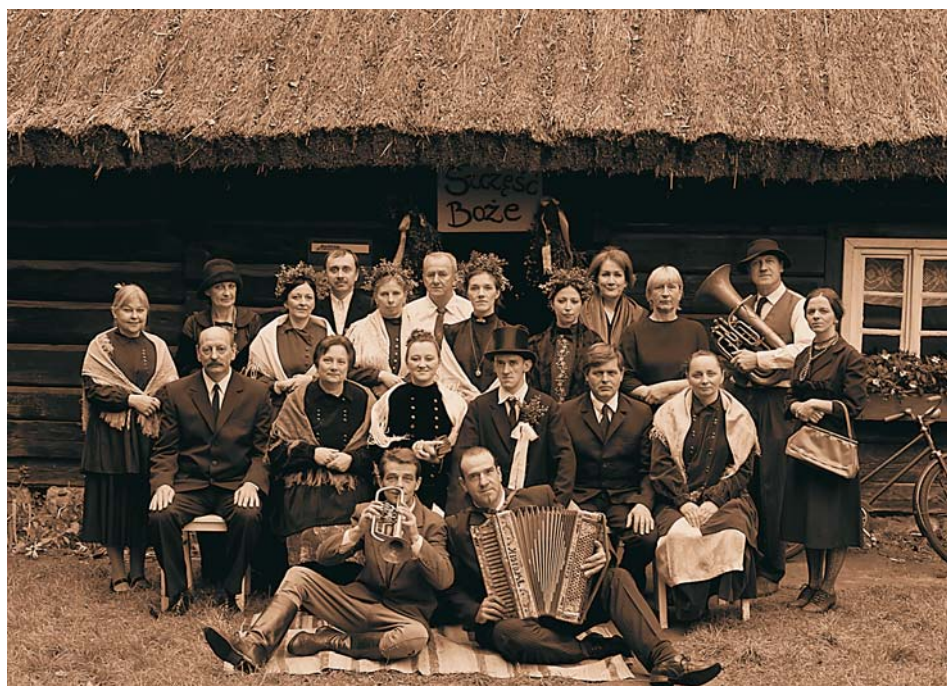
15. Fotografia do kalendarza na 2011 rok. Do zdjęcia pozują pracownicy Muzeum, 2010 r. (fot. S. Dubiel)

Funkcjonujące w XXI w. skanseny muszą powoli przystosować się do zmian zachodzących w instytucjach kulturalnych na całym świecie. Spełniając swe podstawowe zadania, muszą coraz bardziej skupiać się na popularyzacji i upowszechnianiu kultury ludowej. Działanie to w dużej mierze uzależnione jest od sytuacji finansowej placówek tego typu. Oferta muzeum musi być zatem zróżnicowana i atrakcyjna zarówno dla osób dorosłych, jak i dzieci. Ponadto proponowane przedsięwzięcia winny być prezentowane w takiej formie, by kultura ludowa i tradycja nie kojarzyły się z nudą, stagnacją i zmurszałymi budynkami.