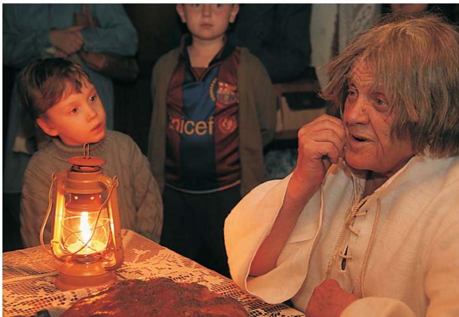
7. Spotkanie z najmłodszymi podczas „Nocy Muzeów”, 2009 r.

go współpracy transgranicznej Republika Czeska – Rzeczpospolita Polska na lata 2007–2013 Euroregion Pradziad. Czeskim partnerem Muzeum w realizacji tego projektu był Urząd Miasta Velká Bystrice z kraju ołomunieckiego. W ostatnich latach jedną z głównych atrakcji festiwalu jest regionalny finał konkursu „Nasze Kulinarne Dziedzictwo – Smaki Regionów” organizowanego przez Polską Izbę Produktu Regionalnego i Lokalnego przy wsparciu Urzędu Marszałkowskiego Województwa Opolskiego oraz we współpracy z Opolskim Ośrodkiem Doradztwa Rolniczego w Łosiowie.