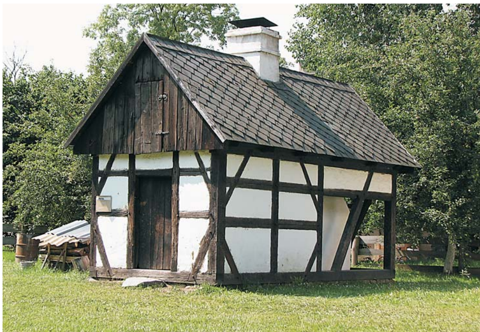
5. Piec do wypieku chleba z Rudziczki

Stary Las (MWO-34/B). W 2006 r. postawiono dużą, przystępną chałupę ze wsi Stary Las (MWO-7/B), która stała się najważniejszym elementem tej zagrody.