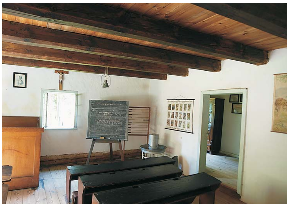
4. Klasa szkoły wiejskiej z początku XX w. – chałupa ze Sternalic, 1859 r.

izby lekcyjnej, w której przedstawiono krótką historię szkolnictwa mniejszościowego, zaś w drugiej części urządzono klasę i mieszkanie nauczyciela wiejskiego z początku XX w., ale bez określenia charakteru narodowościowego ekspozycji.