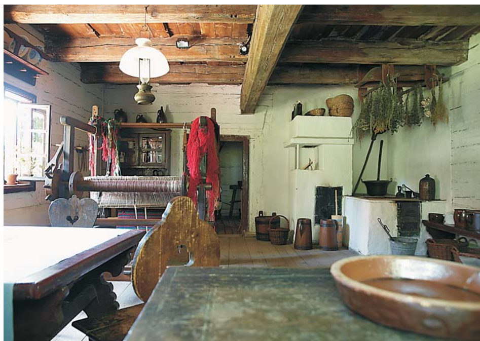
1. Izba zagrodnika z końca XIX w. – chałupa z Kamieńca, 1798 r.

ściowe, powszechne, źle zachowane, wymagające sporych nakładów finansowych na konserwację 28 . Pełniący na początku lat 70. XX w. obowiązki dyrektora Józef Kowalewski wspominał ponadto o trudnościach w gromadzeniu muzealiów ze względu na „podkupowanie niektórych zabytków przez ludzi podszywających się pod pracowników muzealnych” 29 .