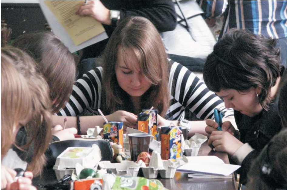
9. Młodzież uczestnicząca w konkursie zdobienia jaj, 2008 r.