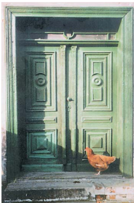
2. Wystawa pt. „Drzwi wiejskie”, 1999 r.

ministra kultury i dziedzictwa narodowego. Celem tego konkursu jest wyróżnienie najwybitniejszych osiągnięć z zakresu wszystkich dziedzin działalności muzealnej. Wśród nagrodzonych i wyróżnionych w tym konkursie wystaw zorganizowanych przez MWO należy wymienić: „Drzwi wiejskie” (1999 r.), „Polecam szanownej publiczności... Reklama w sklepach wiejskich rejencji opolskiej” (2004 r.) „Dryle, plajdry, dreśmasziny. Mechanizacja rolnictwa na wsi śląskiej” (2005 r.), „Cegielnie na Śląsku Opolskim” (2006 r.), „Dachy wsi opolskiej” (2008 r.), „Obrazek dla każdego. Fabryczne obrazy w domach śląskich w latach 1880–1940” (2009 r.) oraz „Kresowianie na Opolszczyźnie 1945–1947” (2010 r.). Obecnie trwają przygotowania dokumentacji do kolejnych przedsięwzięć muzealnych, z którymi Muzeum ma zamiar stanąć do konkursu „Wydarzenie Muzealne Roku – Sybilla 2011”.