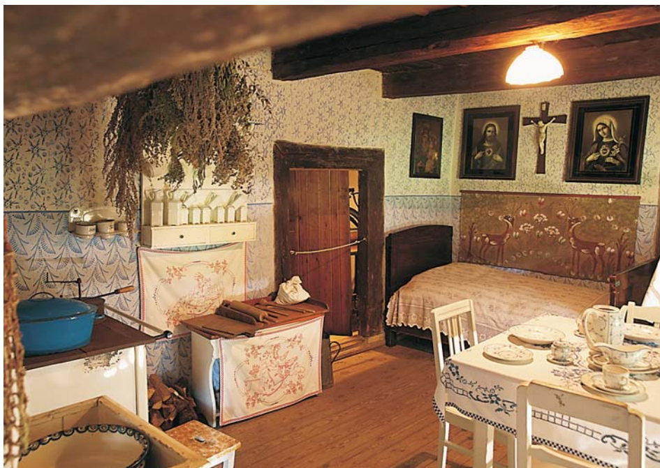
3. Kuchnia z okresu dwudziestolecia międzywojennego – chałupa z Radłowa, 1823 r.

wśród pracowników merytorycznych placówki żywa jest dyskusja na temat stosowności lub niestosowności takich poczynañ. Takie niezdecydowanie i niepewność znalazły wyraz w tym, że nie podjęto decyzji o otoczeniu posesji płotem – budynek ten in situ był przytułkiem, a więc nie był ogrodzony, natomiast w skansenie pełni rolę obiektu mieszkalnego. Z tego powodu w jednej z propozycji założono konieczność ogrodzenia chałupy od tyłu, front miał pozostać nieokolony. Według innej koncepcji proponowano otoczenie płotem całego budynku i założenie ogródka 35 . W materiałach archiwalnych zachowały się trzy scenariusze wyposażenia tej chałupy. Pierwszy – autorstwa Euzebiusza Gila, datujący ekspozycję na koniec XIX w., drugi – Ewy Kurek, przewidywany na okres międzywojenny (ale z umeblowaniem charakterystycznym dla początku XX w.) oraz trzeci – Krystyny Wicher-Jesionowskiej (ówczesnej dyrektor), zakładający urządzenie ekspozycji prezentującej wnętrze z okresu po I wojnie światowej 36 . Różnorodność chronologii zawarta w scenariuszach świadczy o ścieraniu się odmiennych koncepcji tworzenia ekspozycji – według dotych-