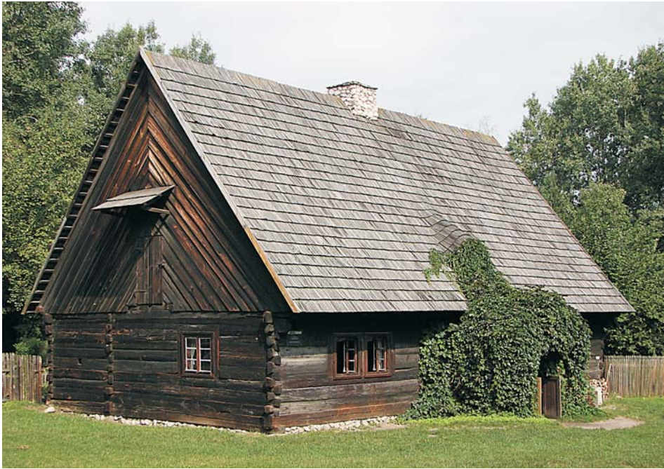
10. Chałupa z Antoniowa

muzealne i warsztaty ceramiczne, wybudowano w 2005 r. zadaszony piec do wypalania ceramiki oraz wiatę. Z kolei w 2009 r. wykonano drewniane ogrodzenie wokół dwóch zagród nyskich, co znacznie wzbogaciło ekspozycję.