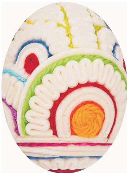
3. Oklejanka wykonana przez Marię Maciak

Omówiona w tak wielkim skrócie kolekcja była wielokrotnie prezentowana na wystawach krajowych i zagranicznych. O niezwyklej popularności opolskich kroszonek świadczy fakt, że w 1999 r. zostały wyróżnione w konkursie na wyrob regionalny.