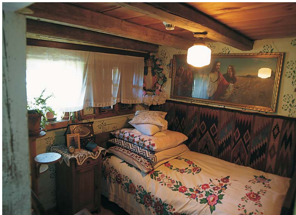
8. Sypialnia Kresowian z lat 40. XX w. – chałupa ze Starego Lasu, koniec XVIII w.

Ekspozycja przedstawiająca domostwo Kresowian powstała w 2008 r. Poświęcono ją repatriantom ze Wschodu, którzy w wyniku akcji zasiedlania tzw. ziem odzyskanych zamieszkali na Śląsku, wnosząc wiele nowych wartości materialnych, duchowych i przestrzennych do dziedzictwa kulturowego tego regionu. Doceniając ten fakt MWO – chociaż z założenia zajmuje się prezentowaniem śląskiej kultury rodzimej – w pierwszych latach XXI w. podjęło decyzję o włączeniu akcentu kresowego do swojej oferty wystawowej. Ekspozycja powstała w jednym z najstarszych budynków znajdujących się w skansenie, czyli w pochodzącej ze Starego Lasu (subregion nyski) XVIII-wiecznej chałupie ryglowo-zrębowej. Wybór padł właśnie na nią, gdyż była to jedyna niezagospo-