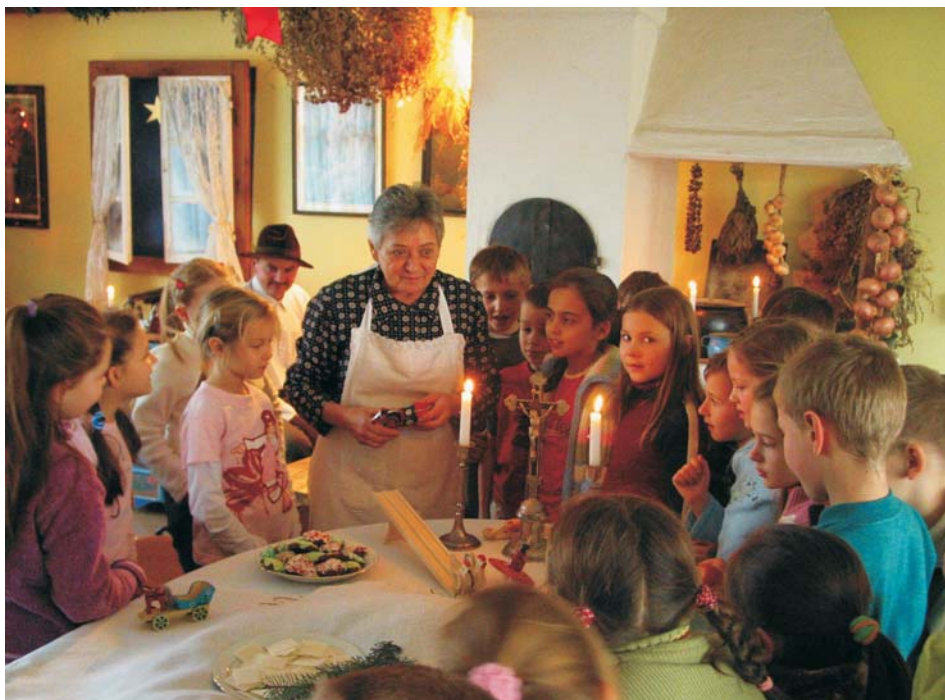
10. Lekcja muzealna „Zanim pierwsza gwiazdka zaświeci”, 2007 r.

w pełni na bezpośredni kontakt z twórczym omawianej dyscypliny rękodziela ludowego i rzemiosła. Początkowo zajęcia uwzględniały jedynie warsztaty wikliniarza i kowala, lecz w późniejszym czasie wzbogacono je także o warsztat garncarza. Od 2000 r. w Muzeum realizowane są również lekcje z cyklu „Od ziarenka do bochenka – chleb nasz powszedni”. Na tych zajęciach można nie tylko poznać historię wyrobu chleba i zdobyć wiedzę na temat jego symboliki czy związanych z nim wierzeń, lecz także można spróbować pieczywa upieczonego podczas lekcji w zabytkowym piecu z Rudziczki. Właśnie ta część zajęć stanowi ich główną atrakcję i sprawia, że chętnych do wzięcia w nich udziału nigdy nie brakuje.