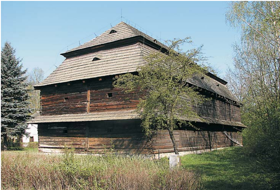
9. Spichlerz ze Sławięcic

Na opisanej wyżej rozległej przestrzeni muzealnej zaprezentowano praktycznie wszystkie ważne obiekty drewnianej architektury wiejskiej, typowej dla wsi