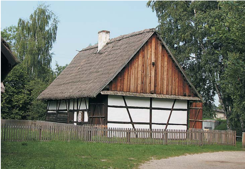
4. Chałupa ze Starego Lasu

z Przewozu spichlerz ze wsi Podlesie (MWO-44/B) i zaczęto rekonstrukcję przysłupowej chałupy ze Starego Lasu (MWO-35/B). W latach 1979–1994 odtworzono sześć obiektów. W 1979 r. na sztucznie usypanym wzgórzu rozpoczęto odbudowę wiatraka ze wsi Dobrzeń Wielki (MWO-20/B), która z przerwami trwała do 1992 r. W 1980 r. odbudowano chałupę ze wsi Sternalice (MWO-43/B) i kapliczkę domkową ze wsi Kotlarnia (MWO-46/B). W przewodniku z 1982 r. E. Gil napisał: „do chwili obecnej odbudowano 44 obiekty” 20 . W 1983 r. zrekonstruowano zagrodę opolską, w której skład weszła chałupa ze wsi Kup (MWO-50/B) i stodoła z Ozimka (MWO-49/B). W 1984 r. odtworzono wieżę ze wsi Gola w konstrukcji szkieletowej, oszalowanej z zewnątrz deskami (MWO-52/B). Ostatnim odbudowanym w omawianym okresie obiektem była postawiona w latach 1993–1994 duża stodoła ze wsi Rudziczka (MWO-32/B), która zapoczątkowała rekonstrukcję kolejnej zagrody nyskiej, prezentującej budownictwo szachulcowe w konstrukcji słupowo-ryglowej.