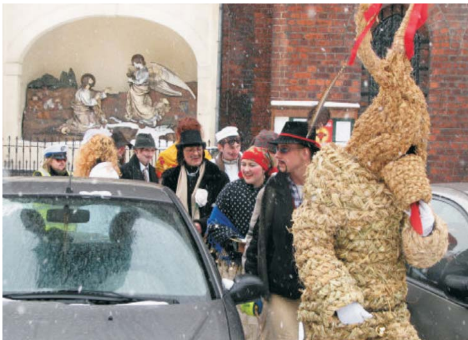
14. Wodzenie niedźwiedzia w wykonaniu pracowników Muzeum poza bramami skansenu, 2009 r.

Podczas pracy nad scenariuszami kolejnych przedsięwzięć główny nacisk kładzie się na popularyzację tradycyjnych obrzędów i zwyczajów Śląska, przy czym nie unika się projektów niszowych, takich jak koncerty kolęd i śpiewu tradycyjnego czy prelekcje z cyklu „Spotkania z kulturą ludową”, które skierowane są do niewielkiego grona odbiorców. Pracownicy Muzeum próbują też wyjść z kulturą ludową poza bramy skansenu. W 2009 r. po raz pierwszy barwny korowód przebierańców, złożony z muzealników ze skansenu, przeszedł ulicami Opola, prezentując jego mieszkańcom utrwalony tradycją zwyczaj „wodzenia niedźwiedzia”. Uczestnicy korowodu odwiedzają „co zaciejszych gospodarzy”, wśród których byli m.in. marszałek województwa i wojewoda opolski, rektorzy opolskich uczelni, a także dyrektorzy muzeów i instytucji kulturalnych, wzbudziło ogromne zainteresowanie wśród napotkanych ludzi. Nowym projektem była także sesja fotograficzna przeprowadzona na terenie muzealnej ekspozycji, w której brali udział pracownicy muzeum. Efektem końcowym tego przedsięwzięcia jest kalendarz na 2011 rok popularyzujący obrzędy i zwyczaje naszego regionu. Został on rozesłany do wybranych instytucji oraz urzędów w regionie i kraju.