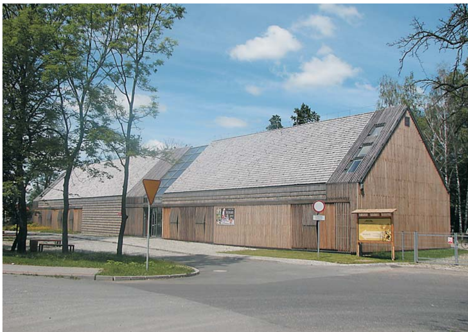
11. Nowy budynek administracyjny

Nie wzniesiono jednak do tej pory betonowych ramp zaplanowanych przez Gurawskiego, które spowodowały tyle różnych, sprzecznych opinii i emocji wśród osób oceniających konkursowe projekty zagospodarowania przestrzennego MWO. Dziś już nikt o nich nie pamięta i nie mówi, gdyż stanowiłyby one sztuczny i mocno rażący twór. Ponadto budowa tych ramp pociągnęłaby za sobą znaczne wydatki, związane nie tylko z ich postawieniem, ale także z ich nieustanną konserwacją.