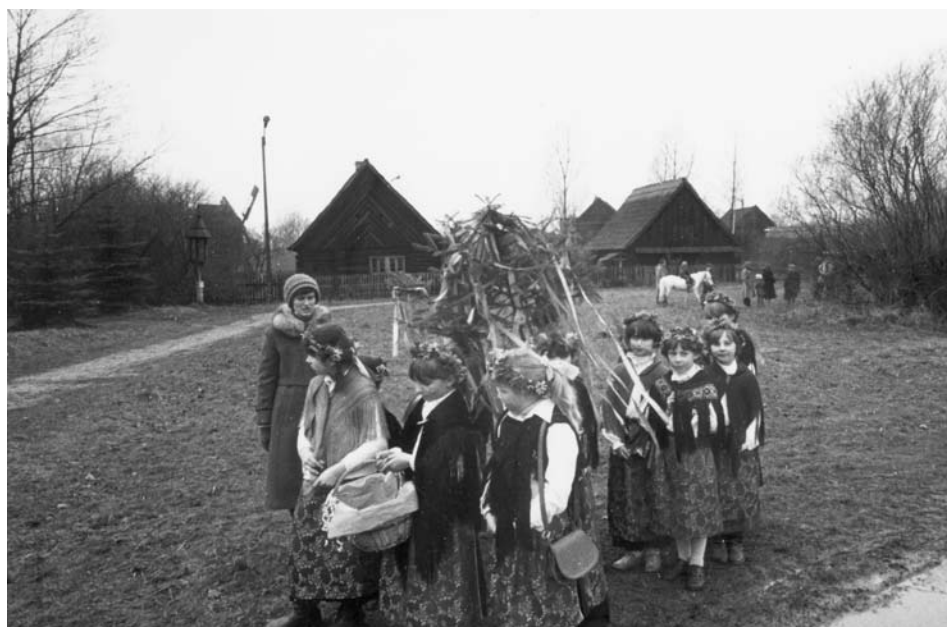
4. Prezentacja obrzędu chodzenia z gaikiem podczas „Jarmarku Kroszonkarskiego”, 1983 r. (fot. arch MWO)