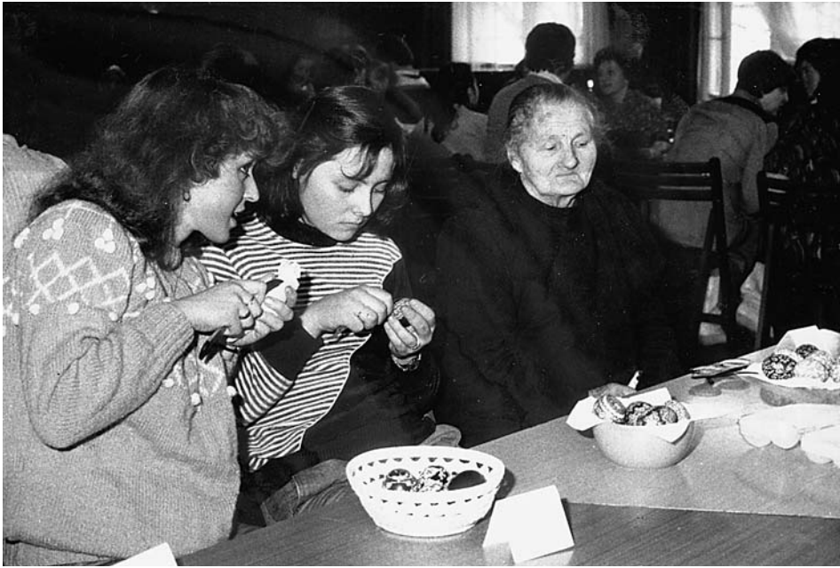
8. Jeden z konkursów współorganizowanych przez Muzeum, 1985 r.