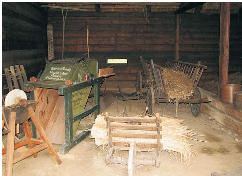
5. Stodoła chałupnika z przełomu XIX i XX w. – budynek z Dąbrówki Dolnej, pierwsza połowa XIX w.

W pierwszej kolejności odtworzono wnętrza stodoł stojących w trzech zagrodach – „Kamieniec”, „Budkowice” i „Wełna”. Ze względu na to, że zagrody te reprezentowały inne grupy socjalno-ekonomiczne, na wyposażenie każdej ze stodoł wybrano takie narzędzia i maszyny rolnicze, które pasowały do nich pod