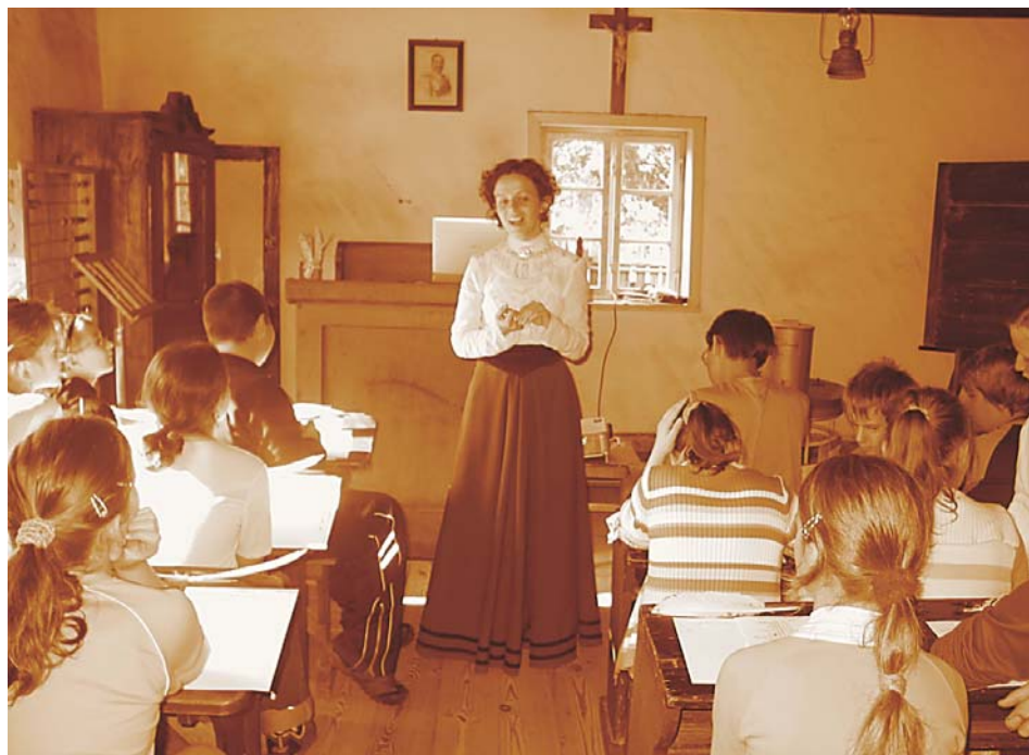
11. Lekcja z cyklu „Jak dawniej w szkole bywało” w zabytkowej szkole na terenie Muzeum, 2006 r.

Ankiety przeprowadzone w 2010 r. wśród nauczycieli uczestniczących w wybranych lekcjach muzealnych świadczą o dużym zainteresowaniu tą formą popularyzacji kultury ludowej. Największe powodzenie wśród najmłodszych odbiorców mają zajęcia warsztatowe oraz te, podczas których omawiane są zwyczaje i obrzędy związane z obchodami świąt dorocznych. Do współpracy przy realizacji wybranych tematów od wielu lat są zapraszani twórcy ludowi