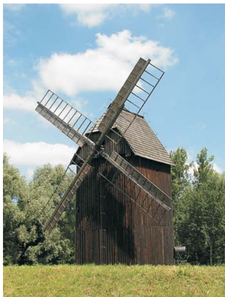
8. Wiatrak z Dobrzienia Wielkiego

dzoną jednostkę z dwoma usytuowanymi frontowo ogródkami kwiatowymi. Samodzielną jednostką ekspozycyjną jest również kuźnia z Ziemielowic (1726 r.), usytuowana przy zakręcie głównej trasy zwiedzania. Nie jest ona wprawdzie ogrodzona, lecz zewsząd otaczają ją różne sprzęty podkreślające jej funkcję użytkową. Następnym obiektem z tej grupy jest chałupa-„szpital” z Radłowa (1740 r.). W przeszłości służyła ona jako wiejski przytułek dla chorych i bezdomnych i nigdy nie miała ogrodzenia; podobnie więc stoi posadowiona w muzeum, choć z innym niż pierwotnie, bogatym wyposażeniem wnętrza. Nie ma ogrodzenia także chałupa z Wichrowa z 1886 r., przystosowana do potrzeb hotelowych skansenu.