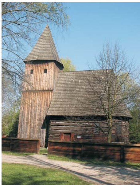
7. Kościół z Gręboszowa