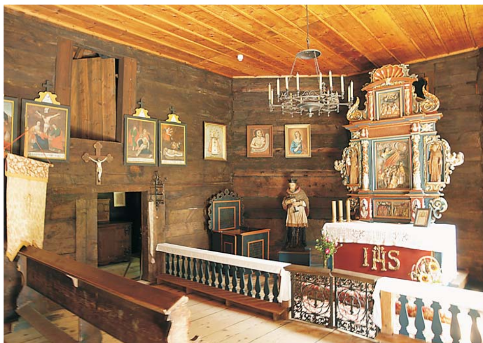
6. Nawa i prezbiterium (fragment) – kościół z Gręboszowa z początku XVI w.

niejącego już kościoła w Opolu-Groszowicach, epitafia oraz ławki i stalle – w nawie, a także polichromowane szafy na paramenty – w zakrystii. Wzięte w depozyt z ewangelickiej kaplicy cmentarnej z Ligoty Górnej koło Kluczborka epitafia chłopskie – jedno z najcenniejszych zabytków eksponowanych w MWO – zostały wykonane w okresie od XVIII do XIX w. na zamówienie rodziców zmarłych dzieci. Zrobiono je z drewna, które następnie pokryto polichromią. Zdobią je wyciągnięte w górę drewniane dłonie służące do zawieszania wianków. O wartości epitafiów decydują nie tylko ich walory historyczne, ale także ogromny ładunek emocjonalny, który płynie od zapisanych na nich tekstów modlitw 47 . Pod koniec lat 90. XX w. dokonano modernizacji wyposażenia świątyni. Ołtarz w zgodzie z tradycyjnym ustawieniem odsunięto od ściany prezbiterium, wykonano kopię antepedium i chrzcielnicę, a także kopię balasek oddzielających prezbiterium od nawy. Ponadto na ścianach zawieszono obrazy olejne i oleodruki, w prezbiterium zaś ustawiono łożę kolatorską. Dopełnieniem ekspozycji stały się obrazy przedstawiające stacje drogi krzyżowej z 1846 r., które wzięto w depozyt z drewnianego kościoła franciszkanów z Borek Wielkich w powiecie oleskim.