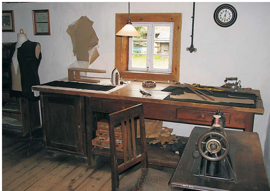
7. Warsztat krawca cechowego z lat 30. XX w. – chałupa z Kup, 1844 r.

W 2006 r. w chałupie z Kup (subregion opolski) otworzono dom wiejskiego krawca cechowego z lat 30. XX w. 48 Ekspozycja składa się z części mieszkalnej i warsztatowej. Ze względu na układ wnętrz i zrekonstruowane wcześniej archaiczne piece ( wieloki ), po raz kolejny należało pójść na pewne ustępstwa. Zburzono wielok w izbie białej, a na jego miejscu postawiono pokojowy piec kafłowy, dzięki czemu pomieszczenie zyskało wygląd pomieszczenia gościnnego. Na jego wyposażenie składa się komplet mebli z lat 30. XX w., typowych dla tego okresu, o ciekawej historii. Zostały zakupione za pieniądze zarobione przez ojca rodziny „na saksach” w Zagłębiu Rhury i długo stanowiły przedmiot dumy całej rodziny, dodając jej splendoru. W czasie działań wojennych w okresie II wojny światowej do domu zawitali rosyjscy żołnierze. Jeden z przybyłych wraz z nimi oficerów położył mokrą czapkę na blacie kredensu, lecz nikt z domowników nie odważył się zwrócić mu uwagi, chociaż wszyscy wiedzieli, że czapka uszkodzi delikatny lakier. Ślad po owej czapce stanowi swoistą pamiątkę tego zdarzenia i jest jedyną plamą na nieskazitelnych meblach.