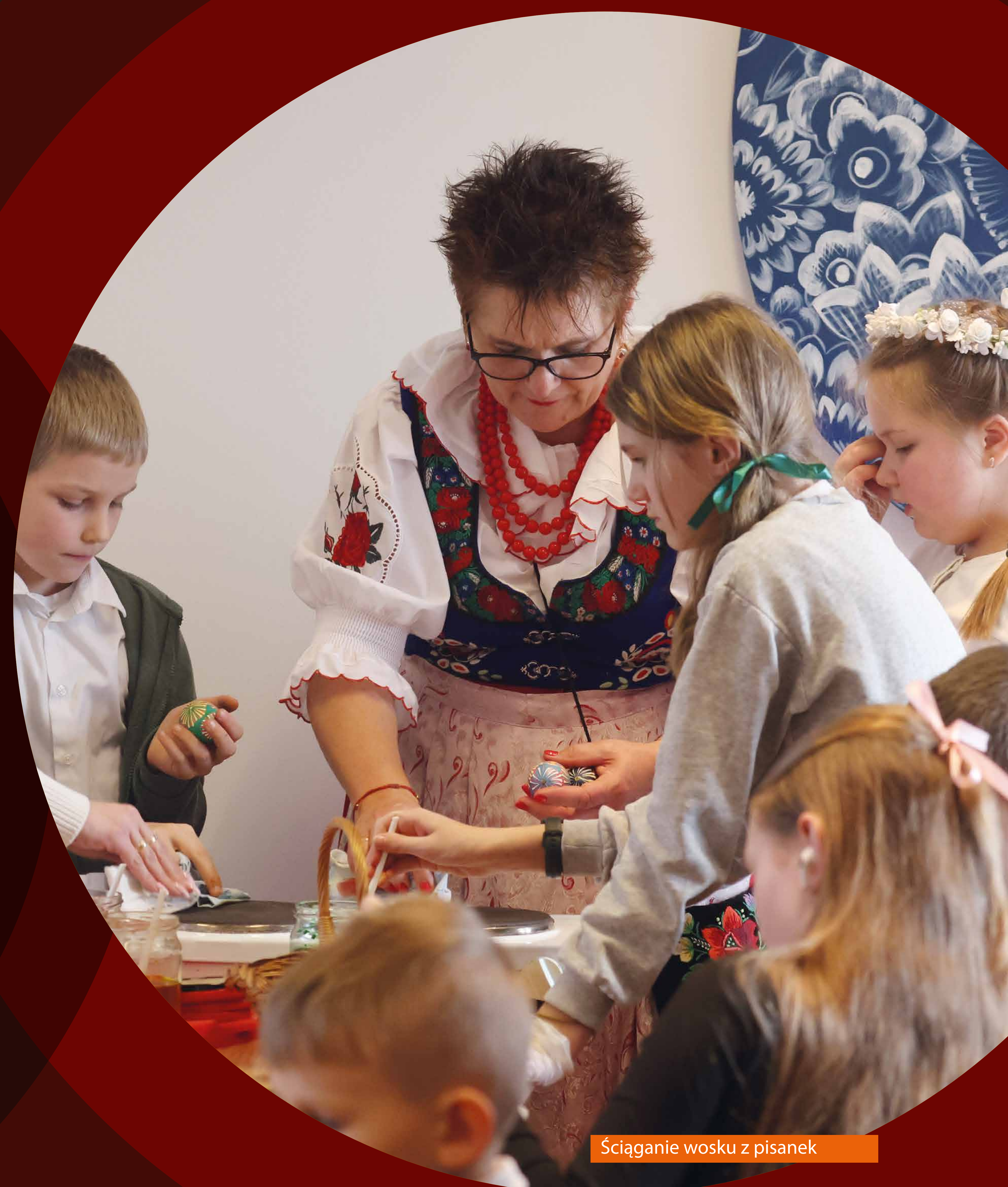
Ściąganie wosku z pisanek