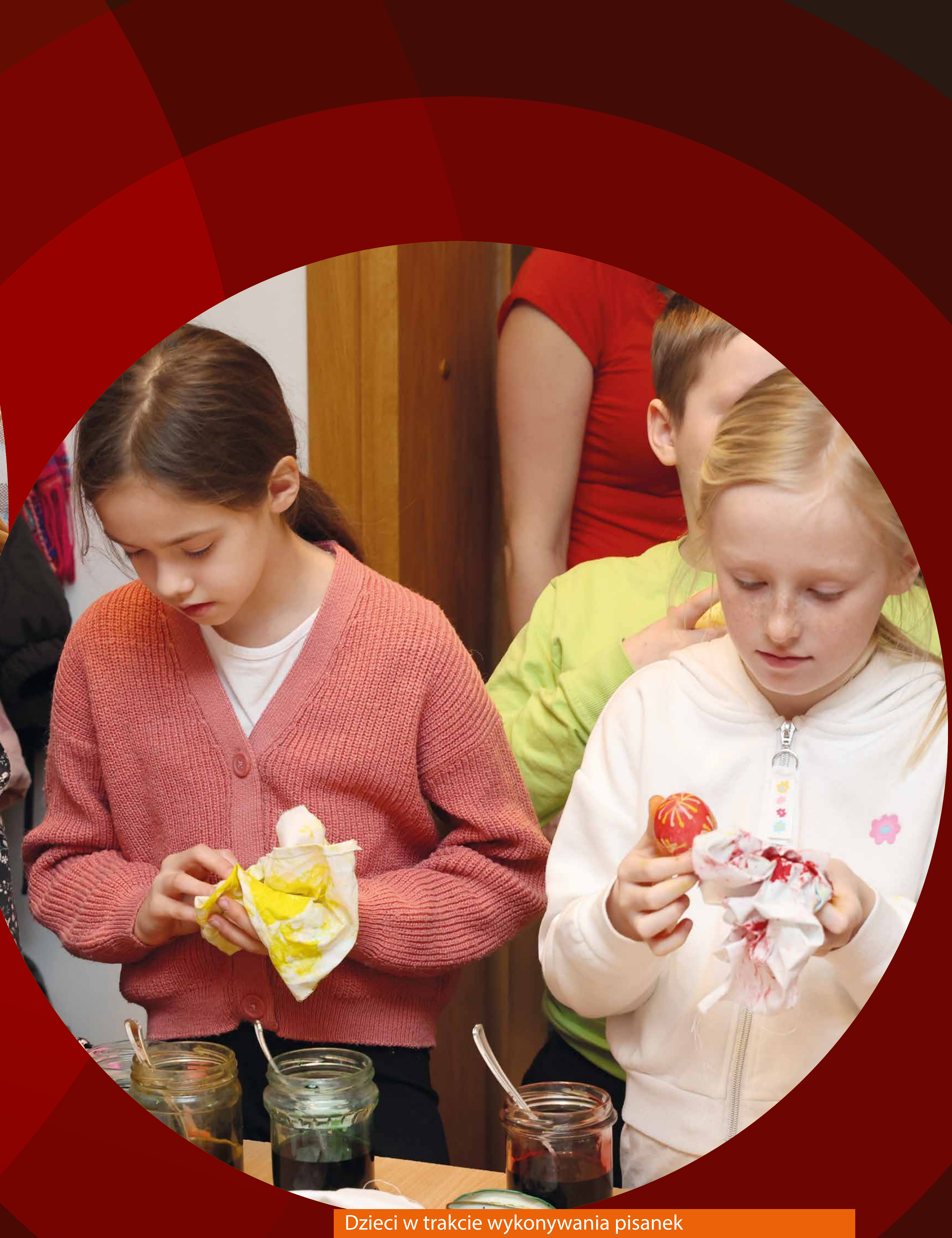
Dzieci w trakcie wykonywania pisanek