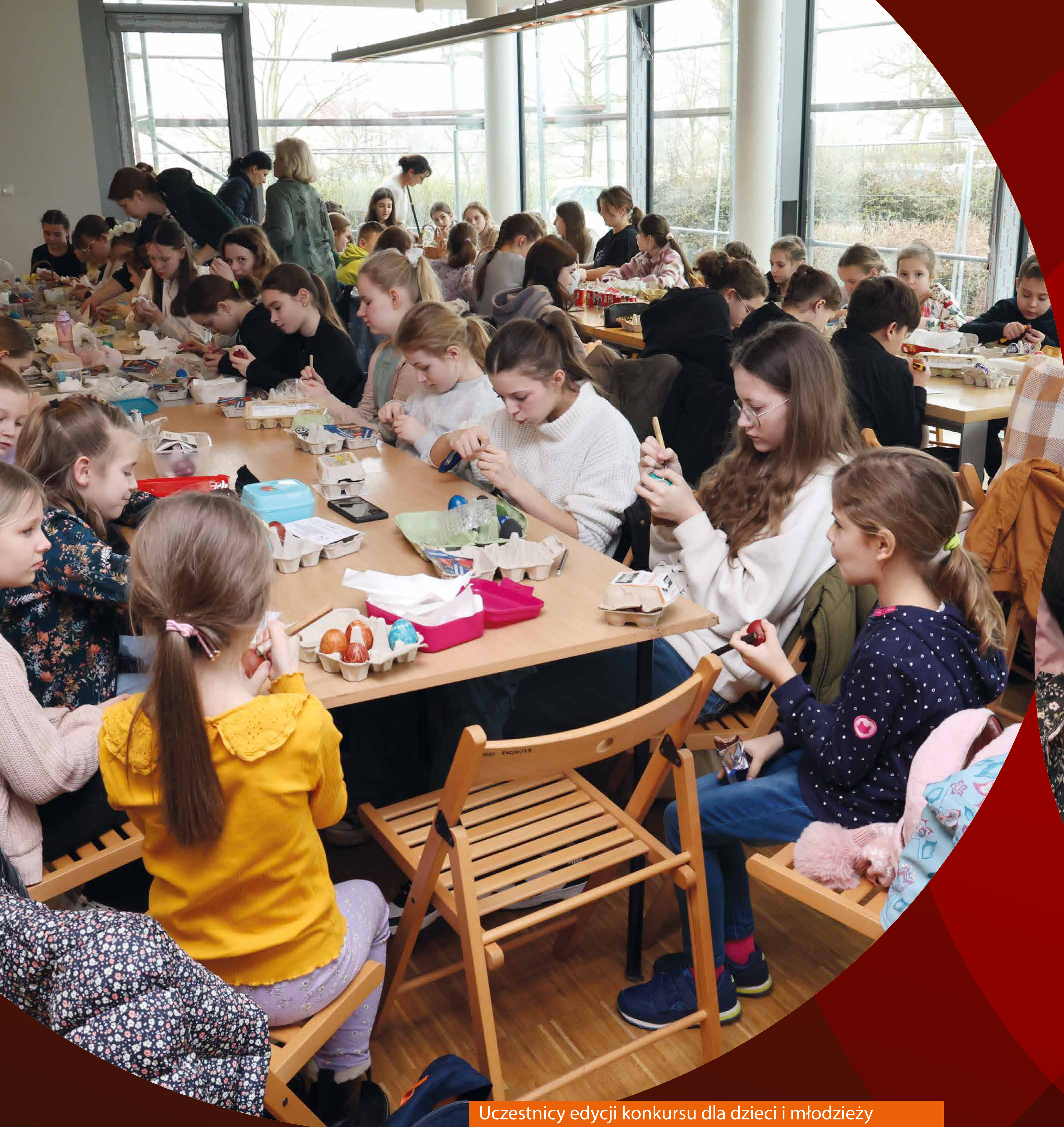
Uczestnicy edycji konkursu dla dzieci i młodzieży