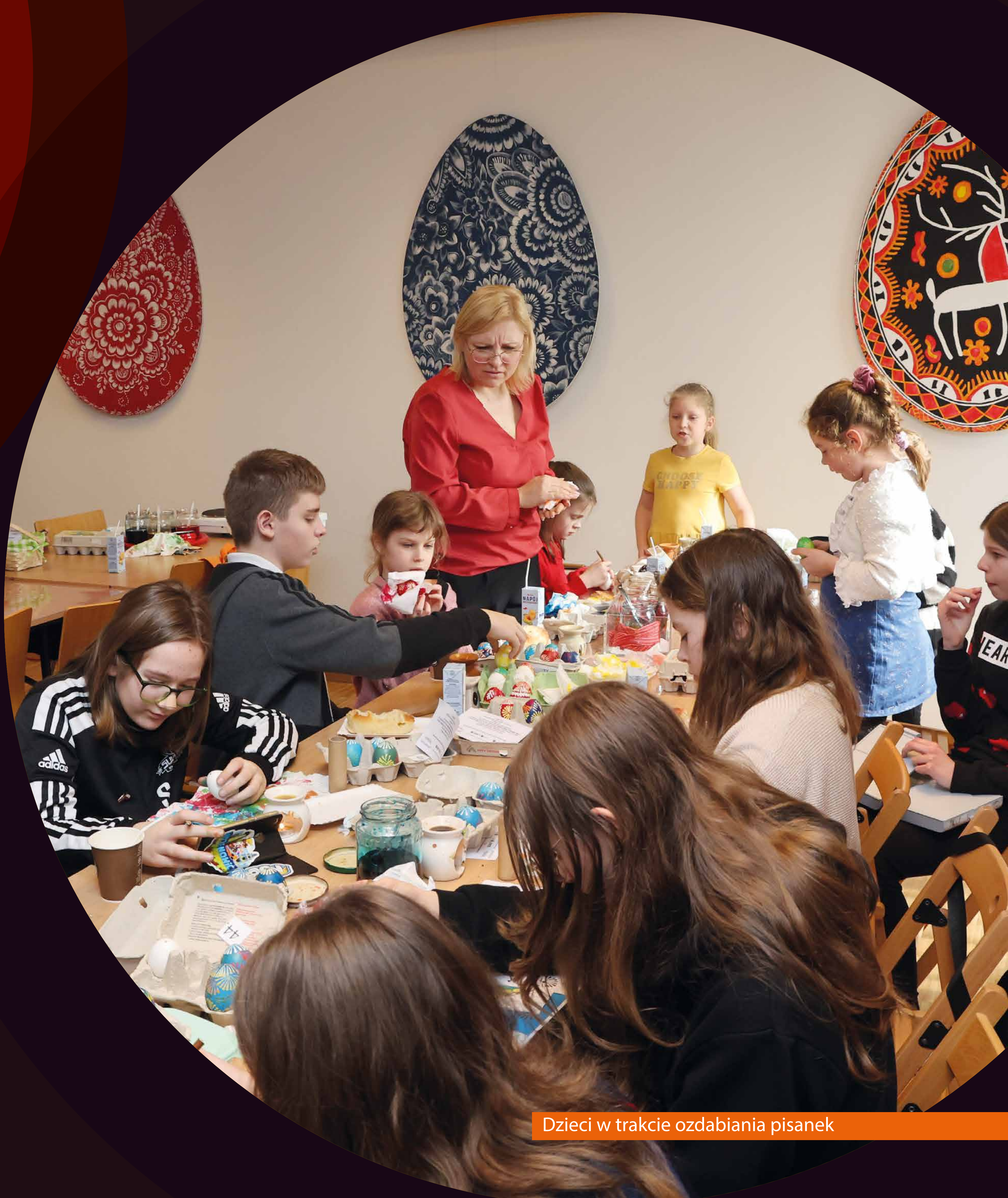
Dzieci w trakcie ozdabiania pisanek