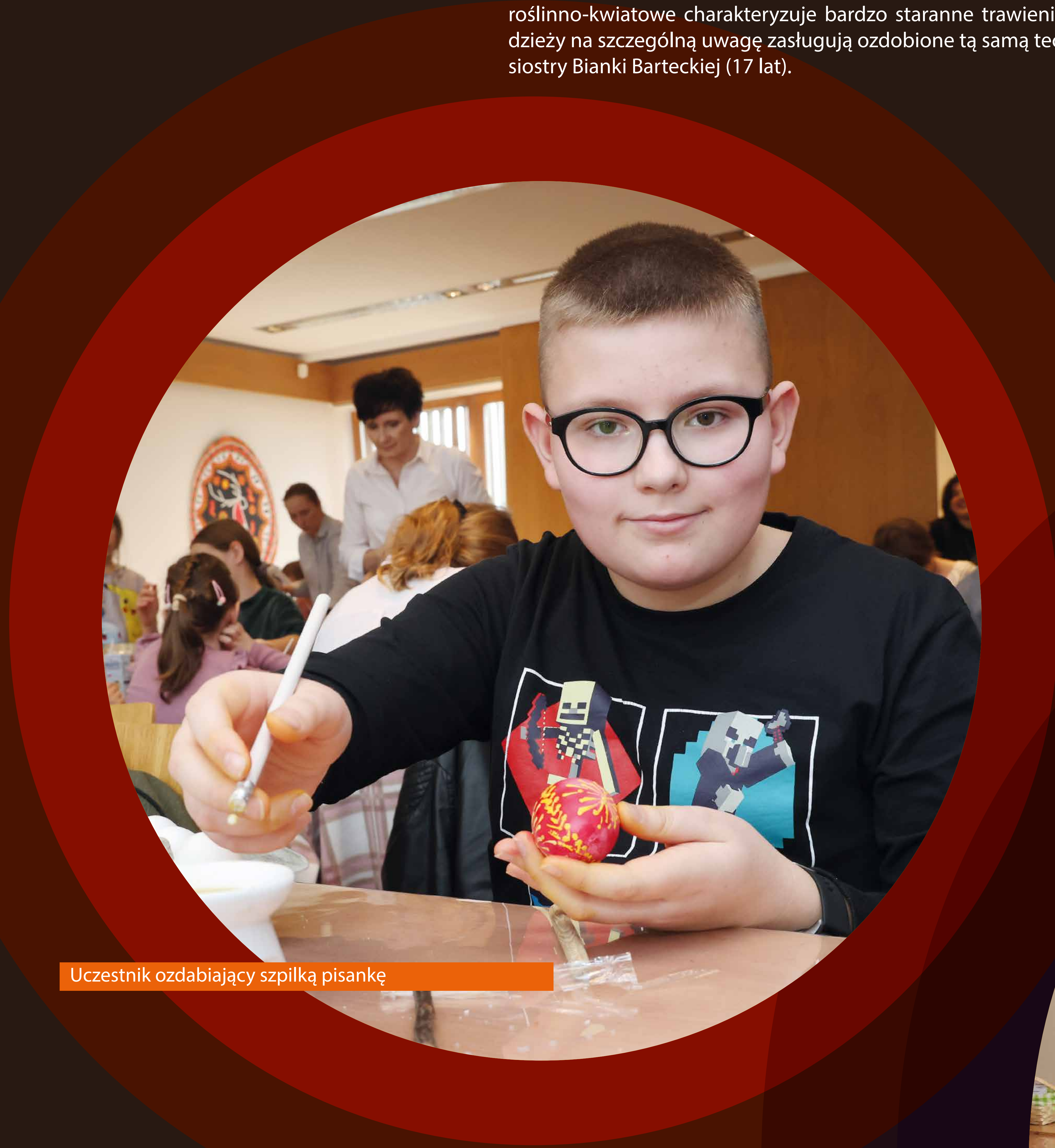
Uczestnik ozdabiający szpilką pisanek